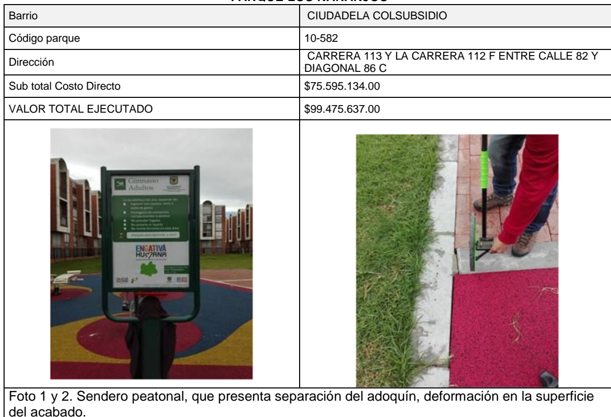
CUADRO No. 9 PARQUE LOS NARANJOS

En el siguiente registro fotográfico se observan las patologías descritas en el presente informe: